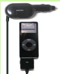
SUNTAC FMトランスミッター

iPod周辺機器の開発・販売も積極的に展開 FMトランスミッターは家電量販店を中心に市場でも高いシェアを獲得