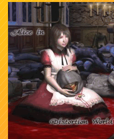
歪みの国のアリス