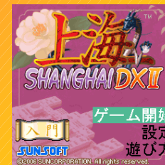
ゲーム開始 設定 遊び方 上海パズル

既存携帯サイトの会員増と平行して、積極的に新規携帯サイトを立ち上げ、さらなる会員数増加を展開