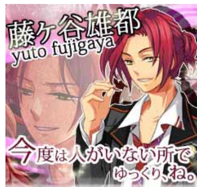
藤ヶ谷 雄都(フジガヤ ユウト) 大人気バンドのギターボーカル