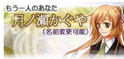
月ノ瀬 かぐや(ツキノセ カグヤ)