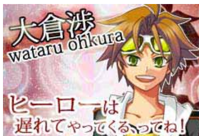
大倉 渉(オクラ ワタル)